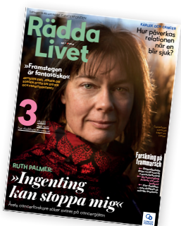
Tidningen Rädsla Livet